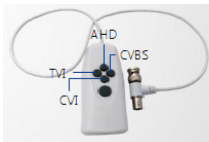
Imagen 2. Control remoto UTC (Up the coax)